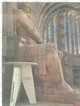
Monumentalfigur der »Optertreudigkeit« mit Teil der neuen Kommentar-Ebene in der Ruhmeshalle.

»Licht bringen« heißt natürlich auch »Orientierung geben« – und so geht das Denkmal seit einiger Zeit verstärkt mit bewährten und neuen Formaten wie etwa Podiumsdiskussionen, Chorkonzerten, Filmreihen und Spezialführungen an die Öffentlichkeit, um seine Rolle als unüberschnehbare Bühne für die großen Fragen unserer Zeit und Gesellschaft wirksamer denn je wahrzunehmen.