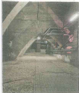
Dick in die Fundamentebene des Denkmals vor Aufstellung der Ausstellungstafeln.

Schwarz vom Kohlenstaub und der Patina vieler Jahrzehnte – als ein solches »Monstrum« ist das Völkerschlachtdenkmal heute noch vielen in Erinnerung. Seit dem Beginn der umfangreichen Generalsanierung 1997 hat sich jedoch einiges getan, und so leuchtet das Monument mittlerweile wieder in warmen Natursteintönen. Dazu trägt auch die mit Unterstützung des Fördervereins erneuerte LED-Beleuchtung bei, die die abendliche Illumination des Denkmals und die Ausleuchtung des vielbegangenen Geländes verlässlich und kostensensibel ermöglicht.